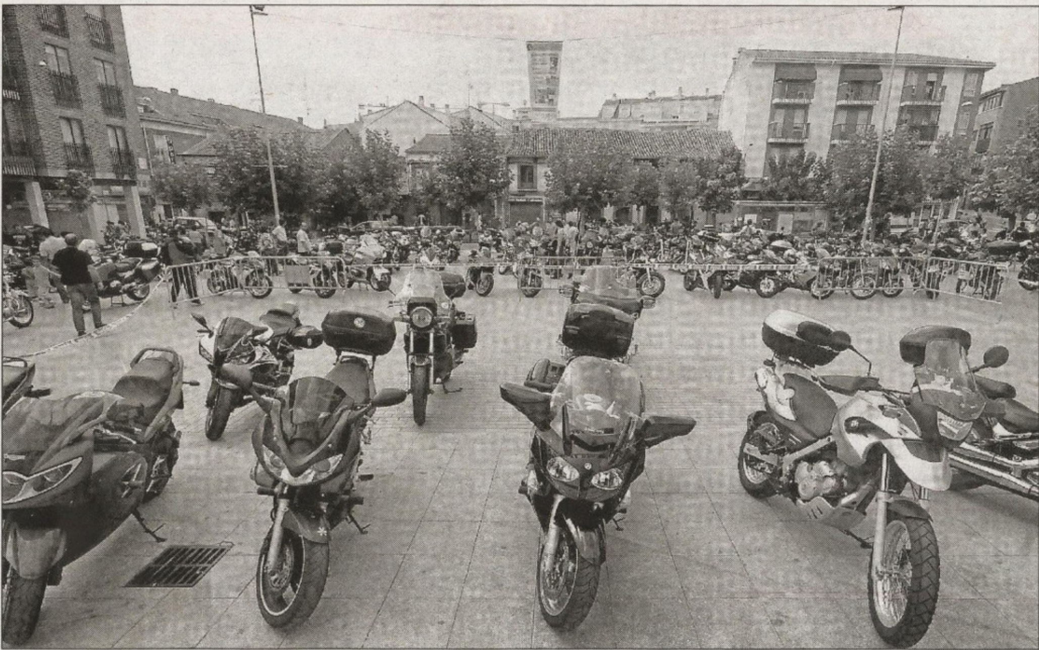
Cientos de moteros se dieron cita ayer en La Cistérniga en la segunda edición de Moteros Solidarios.