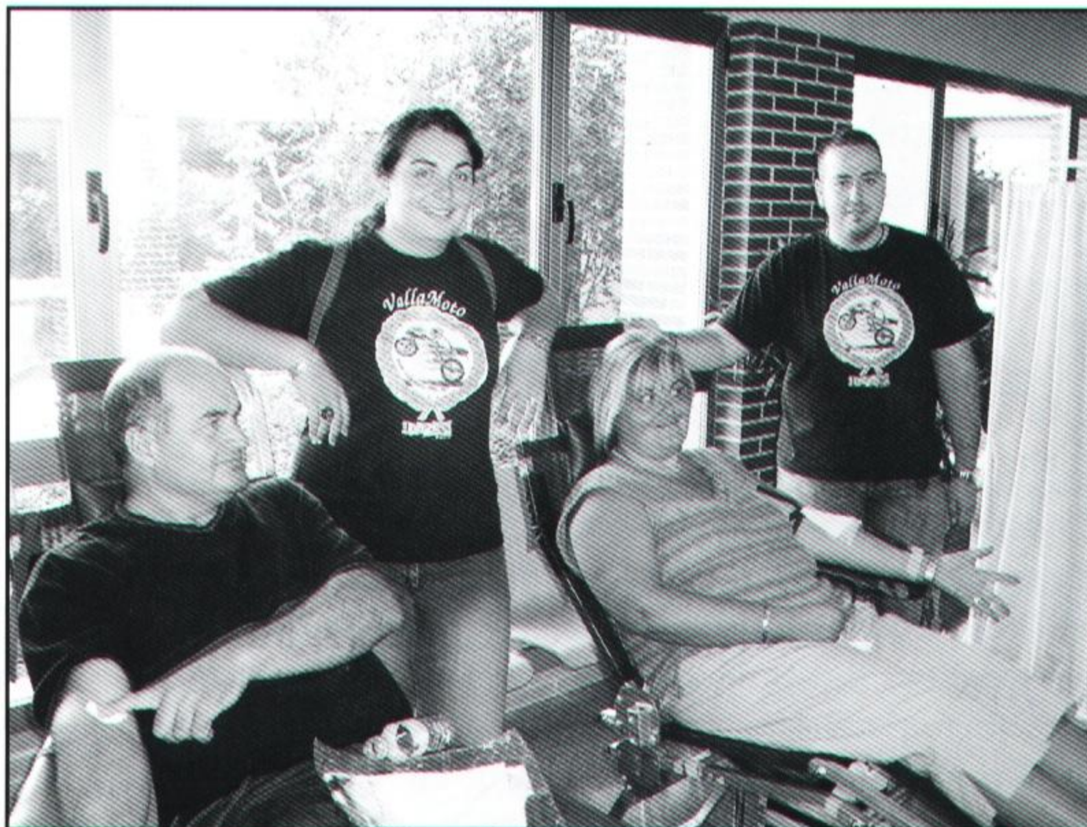
Donantes de sangre en el centro médico de La Cisterniga el 16-9-06