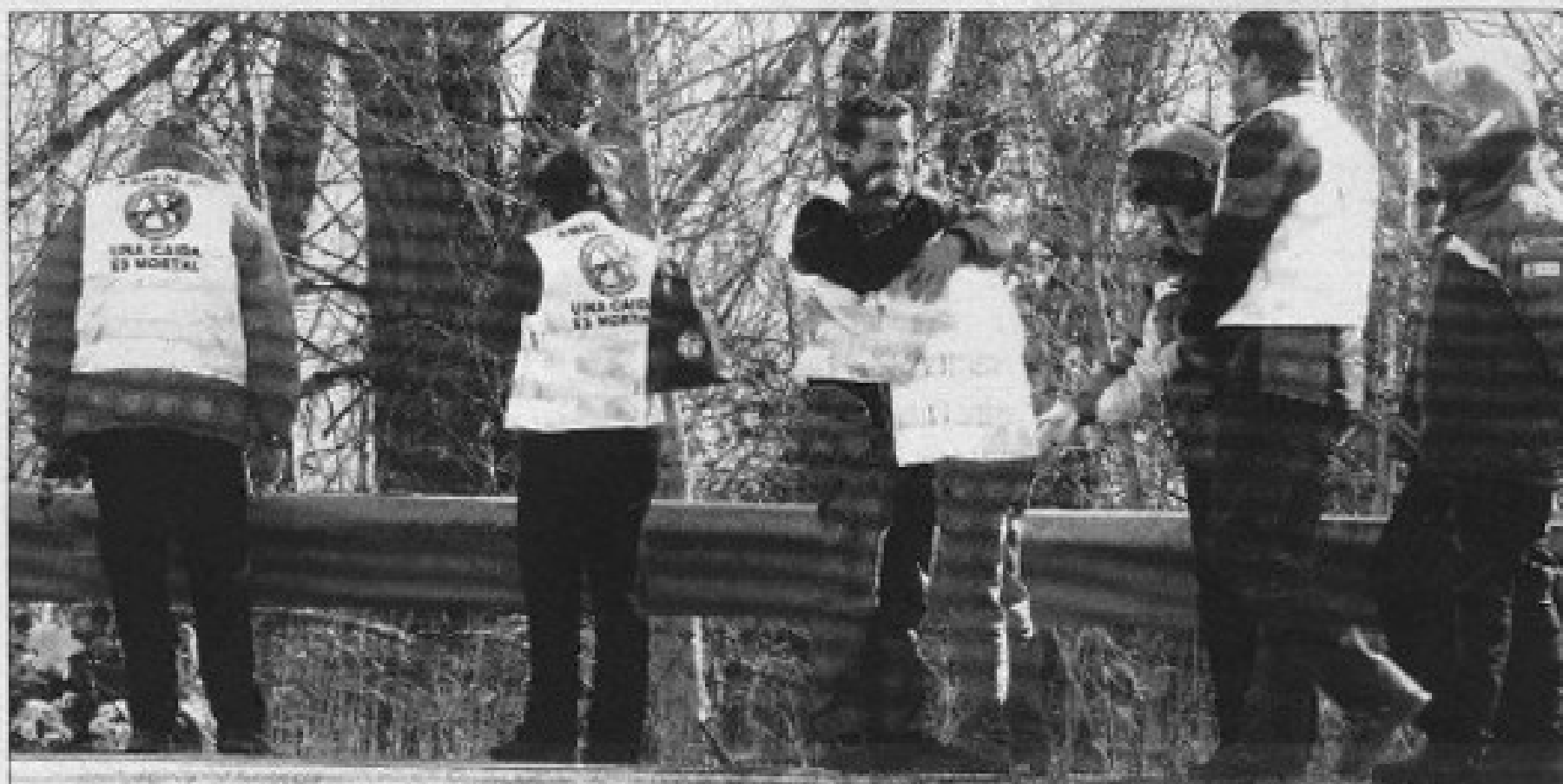
La esposa y un hermano del fallecido se abrazan tras depositar un ramo de flores en el lugar del siniestro.

que en muchos casos fueron los grandes culpables de los desastres», señaló Parellada.