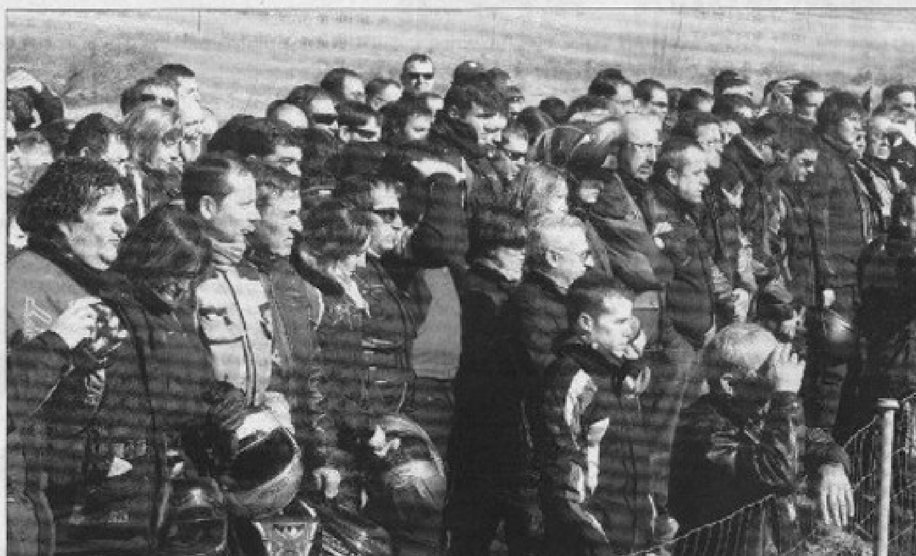
Cientos de aficionados guardaron un minuto de silencio frente al lugar donde se produjo el accidente.

«Durante el pasado año, 306 compañeros murieron en las carreteras de España y aunque no en todos los casos fueron los guardarraíles los culpables, es evidente